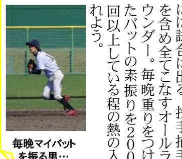
毎晩マイバットを振る男...

◆パンフでPR このほどアルコール治療プログラムのパンフレットが完成。関係各所に配られ