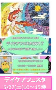
デイケアフェスタ 5/27(土)10~15時