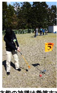
才能の神様は微笑まず

これまで幾度となく雨に阻まれ実施できていなかったグラウンドゴルフ。この日はついに神様を味方につけ、カラリと快晴となった。参加者はグループに分かれスコアを付け合せてゲームを進行する。折角の機会なので記者も試遊させてもらうが、カップに嫌われ中々入らず。ゴルフの神様を味方につけることは叶わなかった。