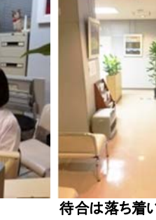
待合は落ち着いた佇まい