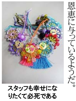
スタッフも幸せになりたくて必死である