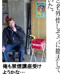
俺も禁煙講座受けようかな...